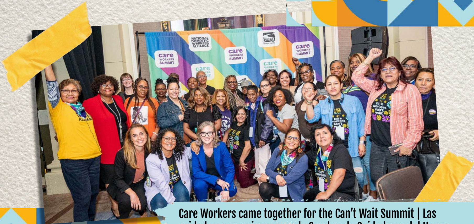
Care Workers came together for the Can't Wait Summit | Las cuidadoras se unieron para la Cumbre de Cuidadoras del Hogar